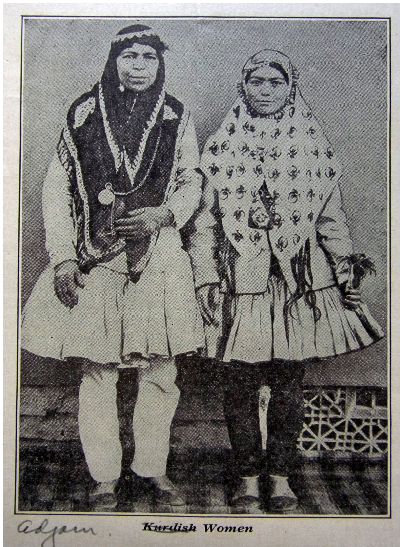
Fot. 2. Kobiety irańskie, 1911 rok (Ludvig O. Fossum, The Great Importance of Moslem Missionary Work ).