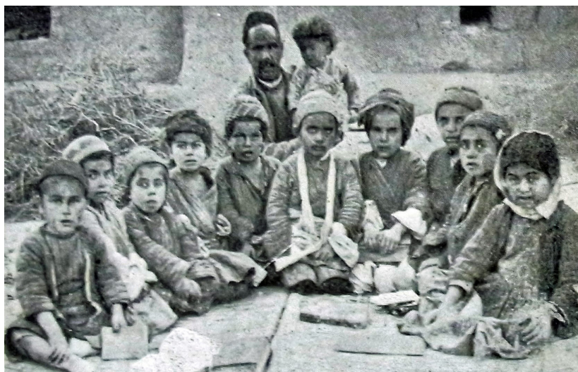
Fot. 6. Dzieci ze szkoły misyjnej, 1912 rok ( The Kurdistan Missionary ).