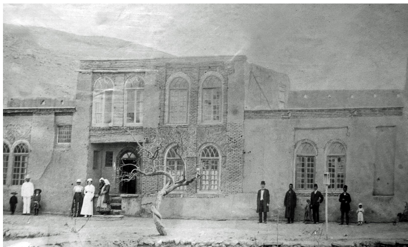
Fot. 4. Budynek misji oraz personel misyjny, 1912 rok ( The Kurdistan Missionary )